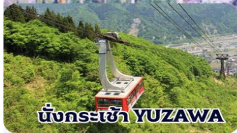
นั่งกระเช้า YUZAWA