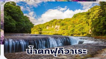
น้ำตกฟุคิอาระ