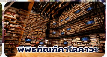
พิพิธภัณฑ์คาโดคาวะ