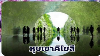
หุบเขาคิโยสึ