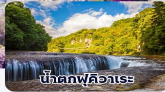
น้ำตกฟุคิอาระ