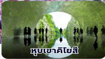
หุบเขาคิโยสึ