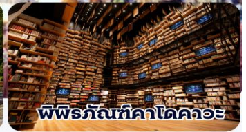
พิพิธภัณฑ์คาโดคาวะ