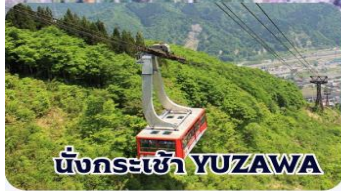
นั่งกระเช้า YUZAWA