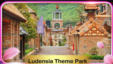
Ludensia Theme Park