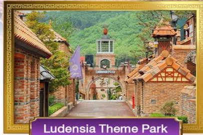
Ludensia Theme Park

• เมนูพิเศษ! ปังย่างเกาหลี, Seafood Hotpot, จิมกัก