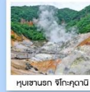
หุบเขานรก จิโกะคุดานิ