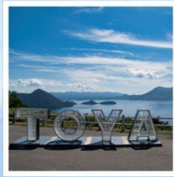
จุดชมวิวไซโล

ชมวิวที่สวยงามที่สุดบนทะเลสาบโทยะ ฌ จุดชมวิวไซโล เมืองสุดแสนโรแมนติก กับถนนสายของหวานชื่อดัง โอตารุ ศิลปะบนนาข้าว เรื่องราวในทุ่งนาสะท้อนจิตวิญญาณแห่งฮอกไกโด ที่ 1 ปี มีครั้งเดียว กิน กิน และ กิน จูใจไปกับเมล่อนเย็นฉ่ำแบบไม่อื่น ชมฟาร์มโคนมชื่อดัง นิเซโกะ ทาคาฮาชิ กับวิวโยเทแสนพิเศษ สวนดอกไม้กับวิวเทือกเขาที่โด่งดังที่สุดแห่งฮอกไกโด ฌ สวนซิกิโซโนะโอกะ พักออนเซ็น 1 คืน!!! พักในเมืองชิโปโร 2 คืน เมนูพิเศษ...บุฟเฟ่ต์เมล่อน, บุฟเฟ่ต์ซาปู, บุฟเฟ่ต์ซาบู, บุฟเฟ่ต์บึงย่าง กรุ๊ปสบายๆ เพียง 20 ท่านเท่านั้น!!!