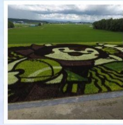
ศิลปะบนนาข้าว