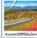
สวนดอกไม้ชิโรโตะโนะโอะ