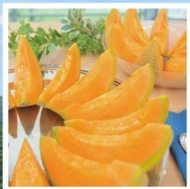
ศูนย์จำหน่ายเมล่อนยูบาริ