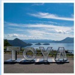
จุดชมวิวไซโล

ชมวิวที่สวยงามที่สุดบนทะเลสาบโทยะ ฌ จุดชมวิวไซโล เมืองสุดแสนโรแมนติก กับถนนสายของหวานชื่อดัง โอตารุ ศิลปะบนนาข้าว เรื่องราวในทุ่งนาสะท้อนจิตวิญญาณแห่งฮอกไกโด ที่ 1 ปี มีครั้งเดียว กิน กิน และ กิน จูใจไปกับเมล่อนเขียนจำแบบไม่อื่น ชมฟาร์มโคนมชื่อดัง นิเซโกะ ทาคาฮาชิ กับวิวโยเทแสนพิเศษ สวนดอกไม้กับวิวเทือกเขาที่โด่งดังที่สุดแห่งฮอกไกโด ฌ สวนซิกิโซโนะโอกะ พักออนเซ็น 1 คืน!!! พักในเมืองชิโปโร 2 คืน เมนูพิเศษ...บุฟเฟ่ต์เมล่อน, บุฟเฟ่ต์ซาปู, บุฟเฟ่ต์ซาบู, บุฟเฟ่ต์บึงย่าง กรุ๊ปสบายๆ เพียง 20 ท่านเท่านั้น!!!