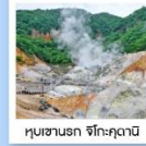
หุบเขานรก จิโกะคุดานิ