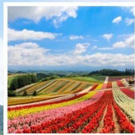
สวนดอกไม้ซิกิโซโนะโอกะ