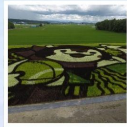
ศิลปะบนนาข้าว