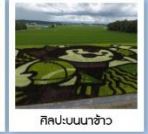
ศิลปะบนนาข้าว

หมู่บ้านราเม็ง / TAMBO ART ศิลปะบนนาข้าว / บ่อน้ำสีฟ้า น้ำตกชิราอิเกะ / สวนดอกไม้ชิโรโตะโนะโอะ /ทุ่งดอกคาเวนดอร์ ศูนย์จำหน่ายเมล่อนยูบาริ / หุบเขานรกจิโกะคุดานิ จุดชมวิวยุไซโตะ / ฟาร์มมิเซโกะ ทาคาฮาชิ / พิพิธภัณฑ์กล่องดนตรี นาฬิกาไอน้ำโบราณ / โรงเป่าแก้วคิตาอิชิ / โรงงานช็อกโกแลตอิชิยะ