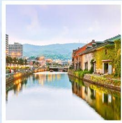
เมืองโอตารุ