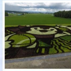
ศิลปะบนนาข้าว