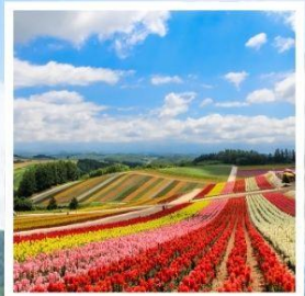
สวนดอกไม้ซิกิโซโนะโอกะ