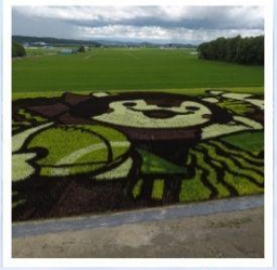
ศิลปะบนนาข้าว