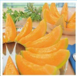
ศูนย์จำหน่ายเมล่อนยูบาริ