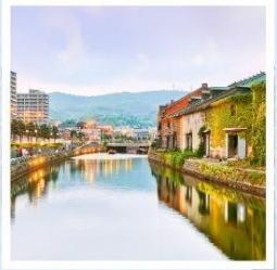
เมืองโอตารุ