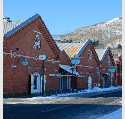
Kanemori Red Brick Warehouse

จากนั้นนำท่านสู่ ป้อมโกเรียวกาดุ (Fort Goryokaku) หรือเรียกอีกชื่อหนึ่งว่าป้อมดาว 5 แฉก เพราะบริเวณนั้นเป็นพื้นที่ขนาดใหญ่รูปดาว เนื่องจากต้องการเพิ่มพื้นที่ในการวางปืนใหญ่ขึ้นเอง ซึ่งจะมองเห็นได้จากมุมสูง ป้อมสร้างตามสไตล์ตะวันตก สร้างขึ้นในปีสุดท้ายของสมัยเอโดะเพื่อป้องกันเมืองฮาโกดาเตะจากการคุกคามจักรวรรดินิยม และในปัจจุบันสถานที่แห่งนี้ได้ถูกพัฒนาให้กลายเป็นสวนสาธารณะของเมืองฮาโกดาเตะ และถือเป็นจุดชมดอกซากุระ และใบไม้เปลี่ยนสีที่สวยงามที่สุดแห่งหนึ่งของเมือง