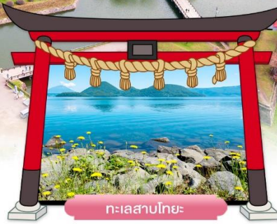
ทะเลสาบโทยะ