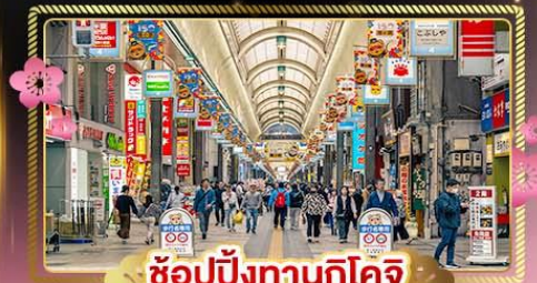
ช้อปปิ้งทานุกิโคจิ