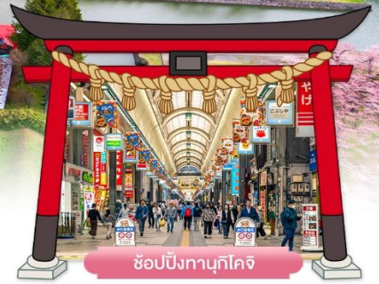
ช้อปปิ้งทานุกิโคจิ