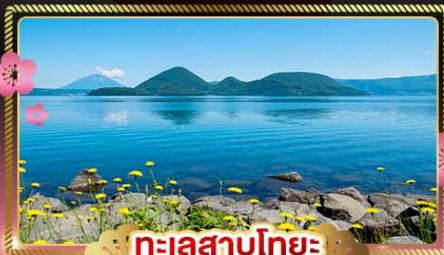
ทะเลสาบโทโยะ