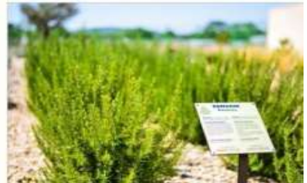
The Mediterranean Garden

จากนั้นนำท่านเดินทางสู่ “เมืองเอ็กซ์ ออง โพรวองส์” (Aix en Provence) ให้ท่านเดินเล่นชมเมืองเพื่อสัมผัสกับวิถีชีวิตของชาวโพรองซ์ กับผลิตภัณฑ์พื้นบ้าน ผัก และผลไม้สดๆจากไร่ ตลาดดอกไม้สด พร้อมชมอาคารบ้านเรือนสไตล์บาร็อกที่หรูหรา ซึ่งอดีตเคยเป็นเมืองเก่าแก่ในสมัยโรมัน ที่มีความรุ่งเรืองเป็นอย่างมาก ต่อมามีการปรับปรุง และมีการก่อสร้างอาคารที่สวยงามมากขึ้น ปัจจุบันจึงเป็นเมืองท่องเที่ยวที่มีความสำคัญเมืองหนึ่ง โดยเฉพาะช่วงที่มีเทศกาลดนตรีในเดือนกรกฎาคม จากนั้นเดินทางสู่ “เมืองมาร์แซย์” (Marseille) เมืองท่าที่สำคัญของประเทศฝรั่งเศส เป็นเมืองชายหาดริเวียร่าที่งดงาม ซึ่งได้ชื่อว่าเป็นประตูเมดิเตอร์เรเนียนของฝรั่งเศส