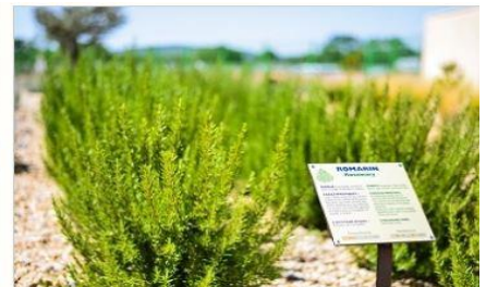
The Mediterranean Garden

จากนั้นนำท่านเดินทางสู่ “เมืองเอ็ซ ออง โพรวองส์” (Aix en Provence) ให้ท่านเดินเล่นชมเมืองเพื่อสัมผัสกับวิถีชีวิตของชาวโพรวองส์ กับผลิตภัณฑ์พื้นบ้าน ผัก และผลไม้สดๆจากไร่ ตลาดดอกไม้สด พร้อมชมอาคารบ้านเรือนสไตล์บาร็อกที่หรูหรา ซึ่งอดีตเคยเป็นเมืองเก่าแก่ในสมัยโรมัน ที่มีความรุ่งเรืองเป็นอย่างมาก ต่อมามีการปรับปรุง และมีการก่อสร้างอาคารที่สวยงามมากขึ้น ปัจจุบันจึงเป็นเมืองท่องเที่ยวที่มีความสำคัญเมืองหนึ่ง โดยเฉพาะช่วงที่มีเทศกาลดนตรีในเดือนกรกฎาคม จากนั้นเดินทางสู่ “เมืองมาร์แซย์” (Marseille) เมืองท่าที่สำคัญของประเทศฝรั่งเศส เป็นเมืองชายหาดริเวียร่าที่งดงาม ซึ่งได้ชื่อว่าเป็นประตูเมดิเตอร์เรเนียนของฝรั่งเศส