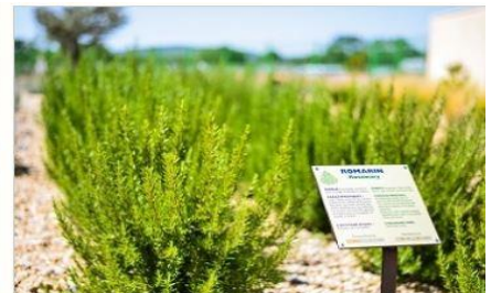
The Mediterranean Garden

จากนั้นนำท่านเดินทางสู่ “เมืองเอ็ซ ออง โพรวองส์” (Aix en Provence) ให้ท่านเดินเล่นชมเมืองเพื่อสัมผัสกับวิถีชีวิตของชาวโพรวองส์ กับผลิตภัณฑ์พื้นบ้าน ผัก และผลไม้สดๆ จากไร่ ตลาดดอกไม้สด พร้อมชมอาคารบ้านเรือนสไตล์บาร็อกที่หรูหรา ซึ่งอดีตเคยเป็นเมืองเก่าแก่ในสมัยโรมัน ที่มีความรุ่งเรืองเป็นอย่างมาก ต่อมามีการปรับปรุง และมีการก่อสร้างอาคารที่สวยงามมากขึ้น ปัจจุบันจึงเป็นเมืองท่องเที่ยวที่มีความสำคัญเมืองหนึ่ง โดยเฉพาะช่วงที่มีเทศกาลดนตรีในเดือนกรกฎาคม จากนั้นเดินทางสู่ “เมืองมาร์แซย์” (Marseille) เมืองท่าที่สำคัญของประเทศฝรั่งเศส เป็นเมืองชายหาดริเวียร่าที่งดงาม ซึ่งได้ชื่อว่าเป็นประตูเมดิเตอร์เรเนียนของฝรั่งเศส