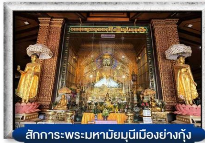
สักการะพระมหาโมกขินทีเมืองย่างกุ้ง