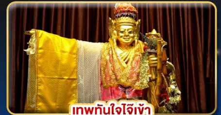
เทพทันใจจีเจ้า