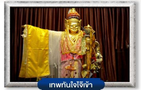
เทพทันใจโจ้เข้า