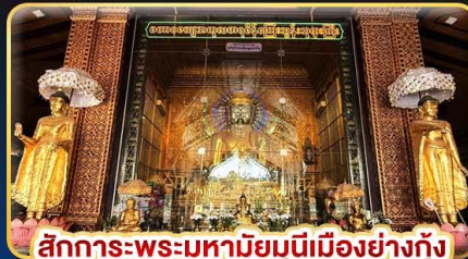
สักการะพระมหาสิริเมืองย่างกุ้ง