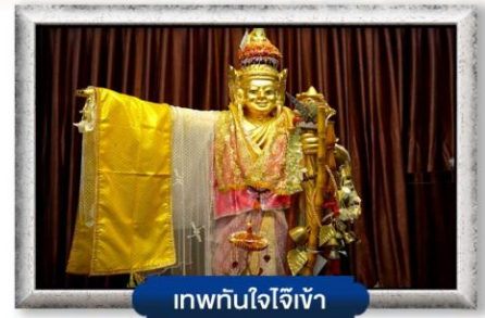
เทพทันใจโจ้เข้า