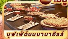
บุฟเฟ่ต์บนบานาฮิลล์