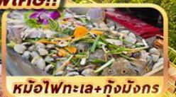
หม้อไฟทะเล+กุ้งมังกร