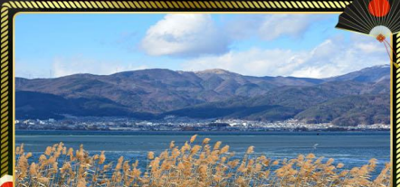
จุดชมวิวกะเลสาบสุวะ