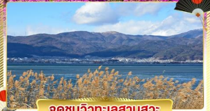
จุดชมวิวกะเลสาบสุวะ