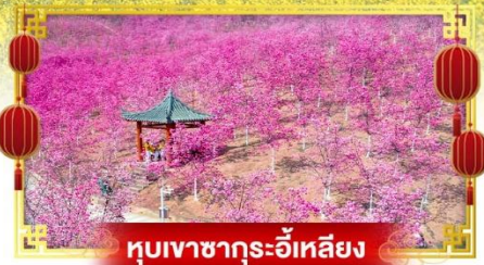
หุบเขาซาคุระอิ๋หลีเยิง