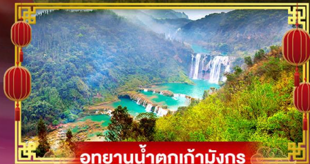
อุทยานน้ำตกเก้ามังกร