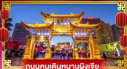
ถนนคนเดินหนานผิงเจีย