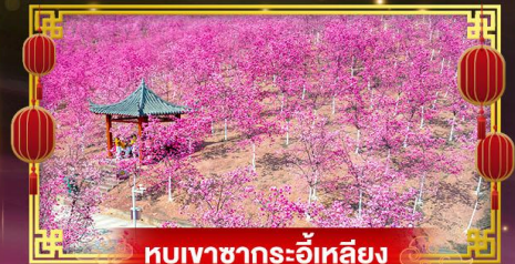
หุบเขาซาถูเอ้อเหลียง