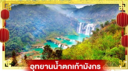
อุทยานน้ำตกเก้ามังกร