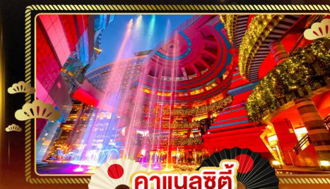
คานาลซิตี