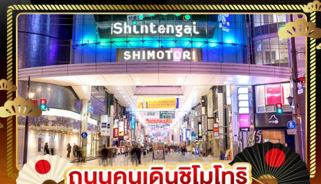
ถนนคนเดินชิโมโตรี