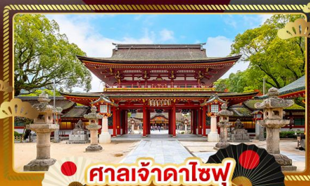
ศาลเจ้าดาโซฟุ