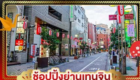
ช้อปปิ้งย่านเทนจิน