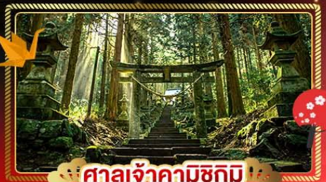
ศาลเจ้าคามิชิกิ