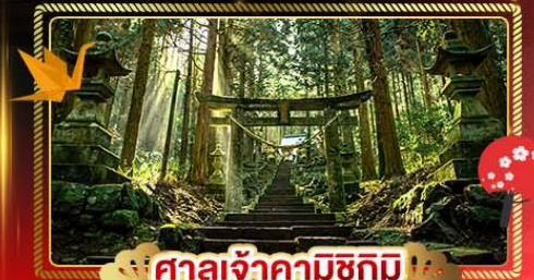
ศาลเจ้าคามิชิกิ