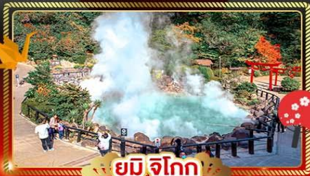
ยุมิจิโอกุ