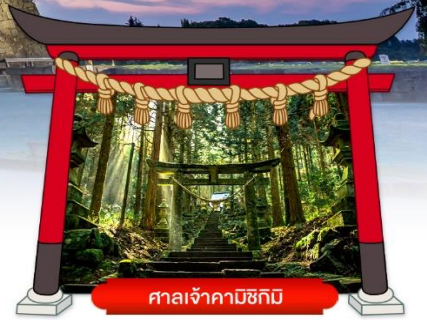
ศาลเจ้าคามิซึกิ