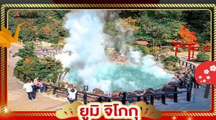
ยูมิจิโกกุ