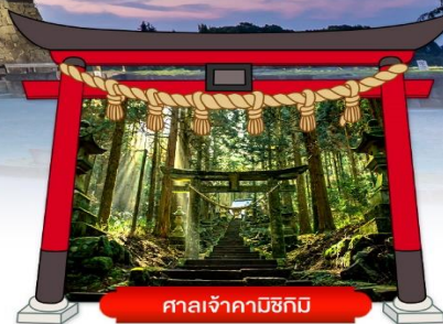
ศาลเจ้าคามิซึกิมิ