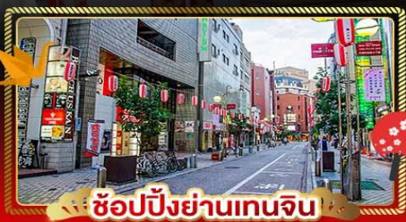
ช้อปปิ้งย่านเทนจิน