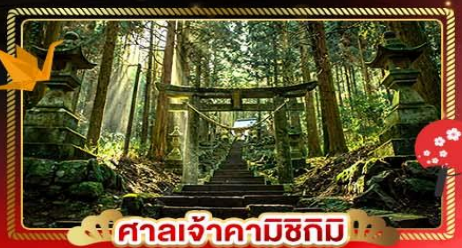
ศาลเจ้าคามิซึกิมิ