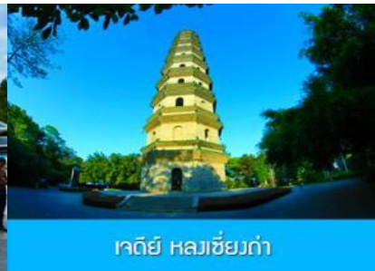
เจดีย์ หลวงซี้ยก่า