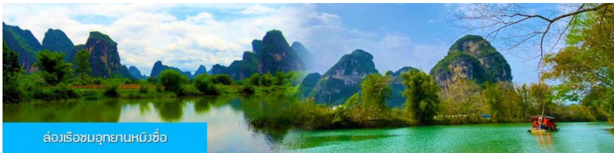
ล่องเรือชมอุทยานหมีวชื่อ