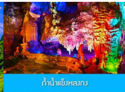
ถ้ำน้ำแข็งหลกง