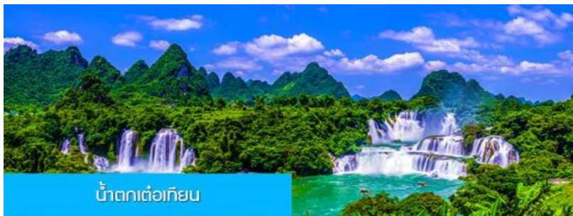
น้ำตกเต๋อเทียน

พักที่ UNIVERSAL HOTEL โรงแรมระดับ 4 ดาวท้องถิ่น หรือเทียบเท่าในเมืองจิ้งซี