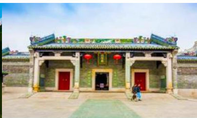
วัดฉิงหวงเมี่ยว