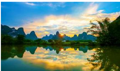
ระเบียบภาพร้อยลี้

พักที่ MINGSHI YISHU HOTEL ระดับ 3 ดาวท้องถิ่นหรือเทียบเท่าในอุทยานหมิงชื่อ