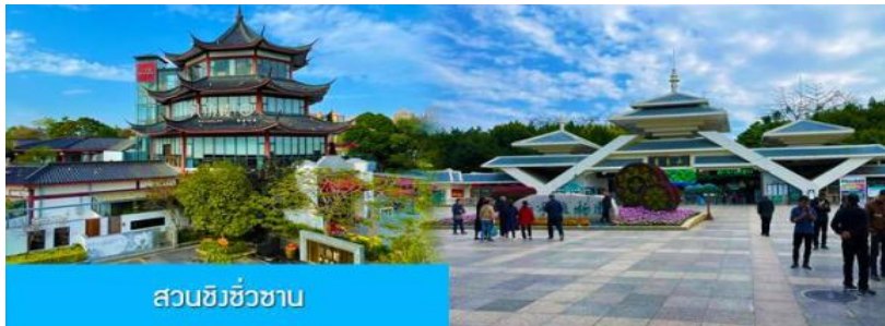
สวนชิวช้วน

อิสระอาหารมื้อเย็น เพื่อความสะดวกในการเดินช้อปปิ้ง ลิ้มรสอาหารท้องถิ่นหลากหลายรสชาติได้ตามอัธยาศัยพักที่ UNIVERSAL HOTEL ระดับ 4 ดาวท้องถิ่นหรือเทียบเท่าในเมืองหนานหนิง