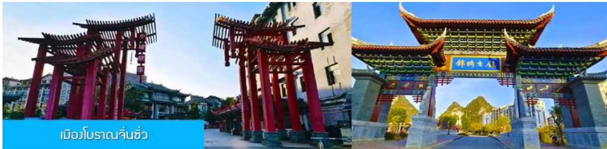
เมืองโบราณจิ่นซิว