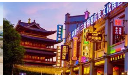
ย่านช้อปปิ้งหลี่งชี่ยง