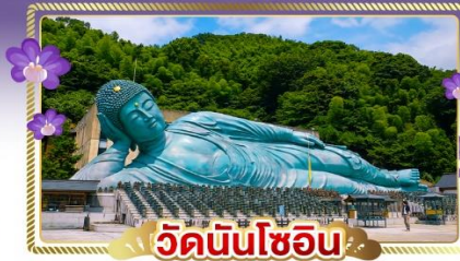
วัดนินโซอิน