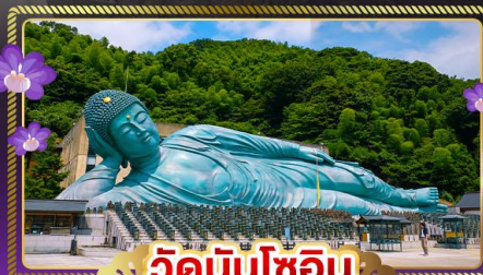
วัดนินโซอิน