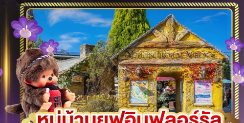
หมู่บ้านยูฟูอินฟลอร์รัล