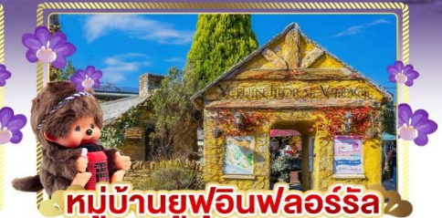
หมู่บ้านยูฟุอินฟลอร์รัล