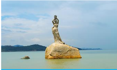
รูปปั้นหญิงสาวประมง