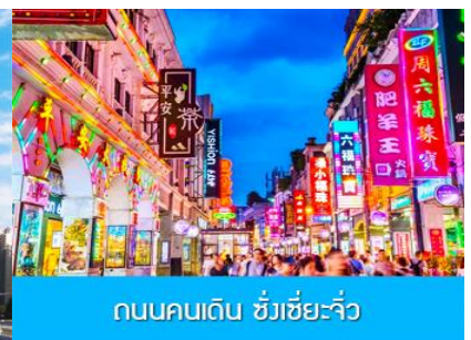
ถนนคนเดิน ซังเซี่ยจิว