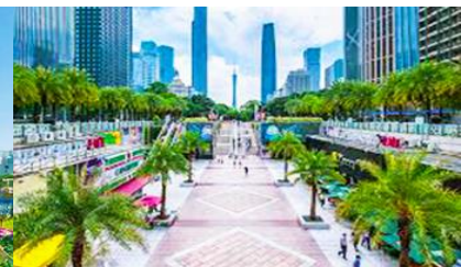
จัตุรัสฮิวเอ็ง