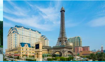
The Parisian Macao

วันที่สาม จูไห่ - รูปปั้นหญิงชาวประมง - วัดผู้ธำช้อ - ศูนย์จำหน่ายหยก-มาเก๊า-เดอะปารีสเซียน-เดอะลอนดอนเนอร์-เดอะเวเนเชียน-จูไห่