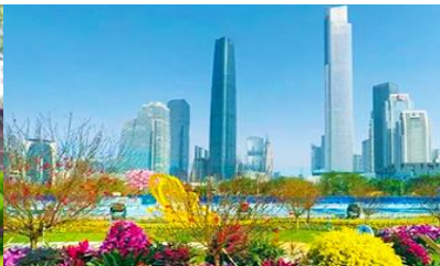
ไห่ฮับซา