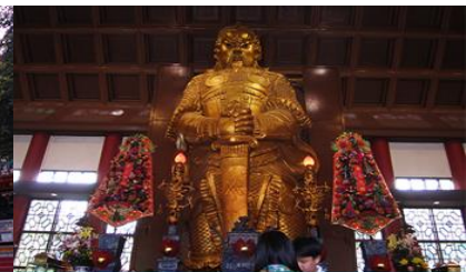
วัดแชกงเมียว