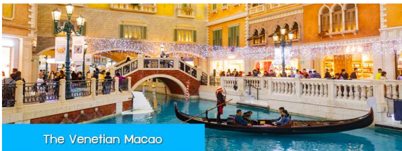
The Venetian Macao