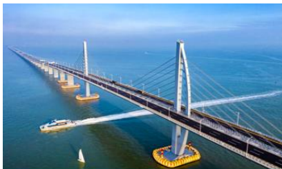
สะพาน ฮ่องกง จูไห่ มาเก๊า

พักที่ IRVINE HOLIDAY HTL OR HUICHANG HTL 3* หรือ โรงแรมในระดับเดียวกันในเมืองจูไห่