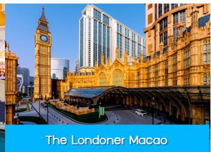
The Londoner Macao

นำคณะขึ้นรถ Shuttle Bus ของโรงแรมเดินทางสู่ เดอะปารีสเซียน มาเก๊า The Parisian Macao และ เดอะลอนดอนเนอร์ the Londoner Macao อัครสถานบันเทิงที่สร้างขึ้นเป็นดาวดวงใหม่ที่เจิดจรัสอยู่เหนือเกาะ