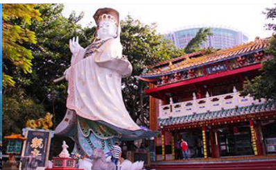
อ่าว Repulse Bay