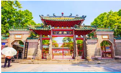
วัดจุ้เมี่ยว

23.30 น. คณะพร้อมกัน ณ ท่าอากาศยานสุวรรณภูมิ อาคารผู้โดยสารขาออก ชั้น 4 ประตู 10 เคาน์เตอร์สายการบิน 9AIR พบเจ้าหน้าที่บริษัทฯ คอยให้การต้อนรับและอำนวยความสะดวกด้านเอกสารและสัมภาระก่อนการเดินทาง