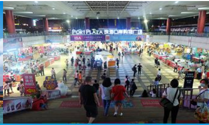
ตลาดใต้ดินก่วงเป่ย์