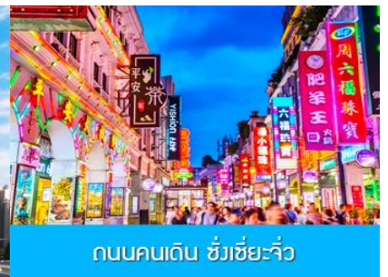
ถนนคนเดิน ซังเซี่ยจิว