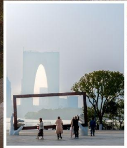
SUZHOU LARGE PHOTO FRAME