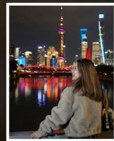
เซี่ยงไฮ้ คลาสสิก ไท่