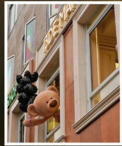
ถนนอันฟู่