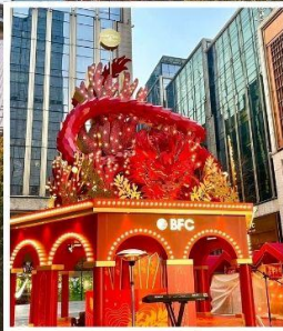
THE BUND WEEKEND MARKET BFC