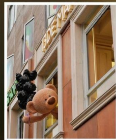
ถนนอันฟู่