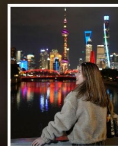
เซี่ยงไฮ้ คลาสสิก ไท่