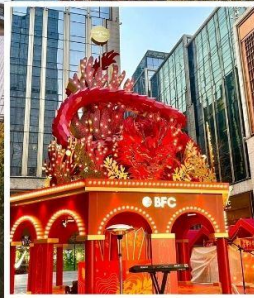
THE BUND WEEKEND MARKET BFC