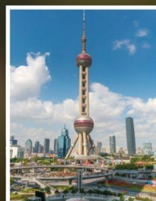
หอนงูมุก