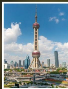
จั๊นหอไข่มุก