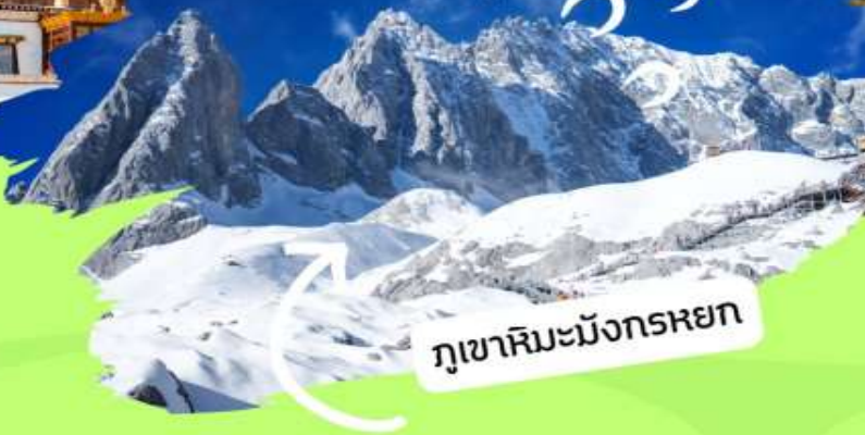
ภูเขาหิมะมังกุรหยก