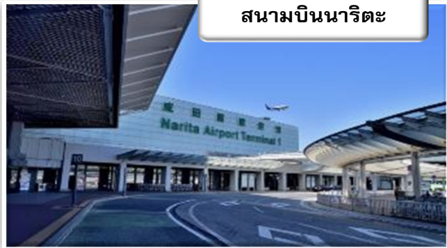
สนามบินนาริตะ

สวนอุเอโนะ (UENO PARK) เรียกได้ว่าเป็นสวนสาธารณะขนาดใหญ่ของโตเกียว โดยภายในมีทั้งวัด ศาลเจ้า ทะเลสาบ และสวนสัตว์ มีต้นไม้มากมายให้บรรยากาศร่มรื่นจึงเป็นที่ที่ชาวโตเกียวนิยมมาพักผ่อนกันมีต้นซากุระเรียงรายอยู่ทั้งสองข้างยาวไปตามทางเดินภายในสวน มีจำนวนมากกว่า 1,000 ต้นซึ่งมักจะบานช่วงประมาณปลายเดือนมีนาคมถึงต้นเดือนเมษายน ทำให้ดึงดูดผู้คนจำนวนมากมาเยี่ยมชมในเทศกาลชมดอกซากุระ หรือที่เรียกกันว่า เทศกาลงานฮานามิ