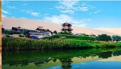
สระน้ำวพระกันร์