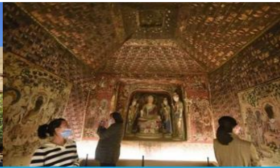
ชมภาพย่นตร์ 3 มิติ