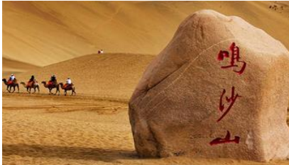
เบ็นกรายหมีวซาซาบ

ค่ำ รับประทานอาหารค่ำ ณ ภัตตาคาร พักที่ METRO PARK HOTEL โรงแรมระดับ 4 ดาวห้องดีนหรือเทียบเท่าในเมืองตุนหวง หลังอาหารให้ท่าน มีเวลาเดินเล่น ช้อปปิ้งใน ตลาดกลางคืน ซาโจว 沙洲夜市 ให้ท่านเลือกซื้อของที่ระลึกของเส้นทางสายไหมได้ตามอัธยาศัย