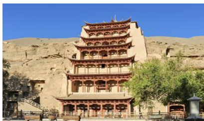
ถ้ำคัมมัวเกาคุ