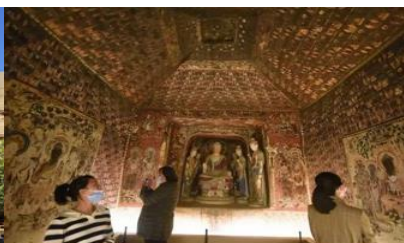
ชมภาพย่นตร์ 3 มิติ