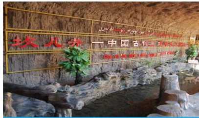
ระบบชลประทานคูหลู่ฟาน