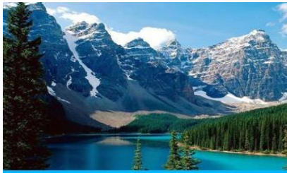
ภูเขาเทียนชาน