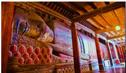
วัดพระใหญ่

พักที่ SILU QIAN XI HOTEL โรงแรมระดับ 4 ดาวท้องถิ่น หรือเทียบเท่าในเมืองจางเจีย