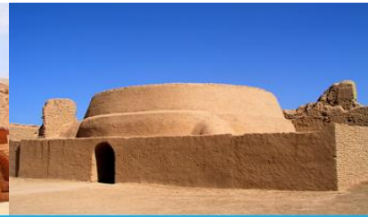
เมืองโบราณเกาซางกูเจิง