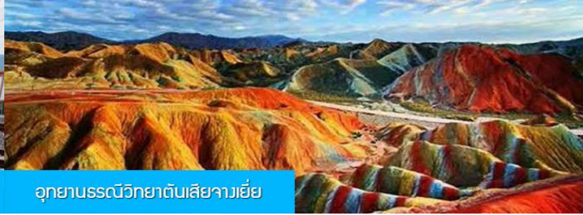
อุทยานธรณีวิทยาต้นเสี้ยวเจียงเยี่ย

วันที่สอง เมืองหลันโจว – นั่งรถไฟความเร็วสูงสู่เมืองจางเยี่ย – เที่ยวชมอุทยานธรณีวิทยาต้นเสี้ยว(ภูเขาสายรุ้ง)