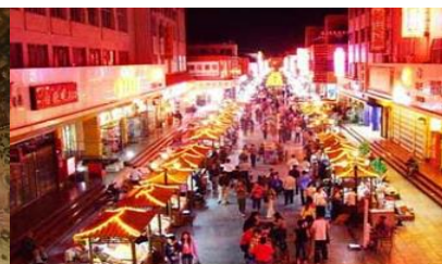
ตลาดกลางคืน ซาโจว

วันที่สี่ ด่านเจียวกวน – เดินทางสู่เมืองตุนหวง – เที่ยวชมถ้ำมัวเกาคุ – ชมภาพย่นตร์ 3 มิติ-ซาโจวในท์มาร์เก็ต