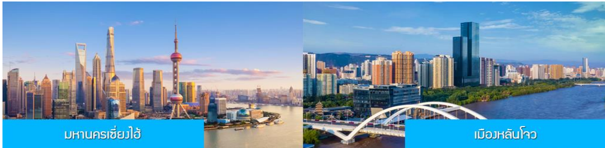
มหานครเซี่ยงไฮ้