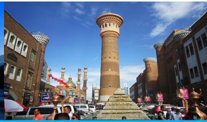
ตลาดต้าปาจา