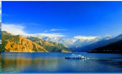
ล่องเรือทะเลสาบเทียนฉือ