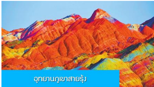
อุทยานภูเขาสายรุ้ง