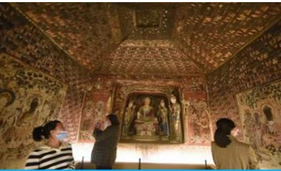
ชมภาพย่นตร์ 3 มิติ