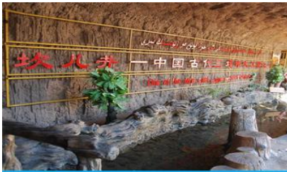
ระบบชลประทานถ้ำหลู่ฟาน

Tel. 02-736 1588 , 02- 736 1599 Fax. 02-736 1522 E-mail. meetawee.suwit@gmail.com