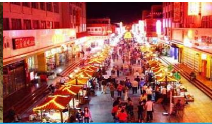
ตลาดกลางคืน ซาโจว

วันที่ 1 ด่านเจียวกวน – เดินทางสู่เมืองตุนหวง – เที่ยวชมถ้ำมั่วเกาคุ – ชมภาพย่นตร์ 3 มิติ-ซาโจวในท์มาร์เก็ต