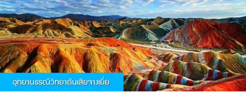
อุทยานธรณีวิทยาต้นเสี้ยวเจียงเย่

วันที่สอง เมืองหลันโจว – นั่งรถไฟความเร็วสูงสู่เมืองจางเย่ – เที่ยวชมอุทยานธรณีวิทยาต้นเสี้ยว (ภูเขาสายรุ้ง)