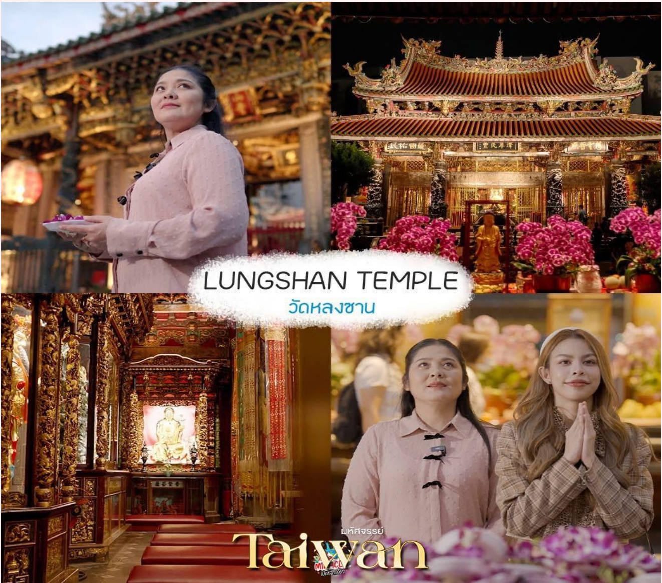
LUNGSHAN TEMPLE วัดหลงซาน

จากนั้น วัดหลงซาน (Longshan Temple) เป็นหนึ่งในวัดที่เก่าแก่และมีชื่อเสียงมากที่สุดแห่งหนึ่งของเมืองไทเป เพื่อเป็นสถานที่สักการะบูชาสิ่งศักดิ์สิทธิ์ตามความเชื่อของชาวจีน ที่เชื่อกันว่าเป็นเทพผู้ผูกดวงแดงให้สมหวังด้านความรัก จนบางคนเรียกกันว่าเป็นวัดสไต้ไต้หัวัน ทำให้ที่นี่เป็นอีกหนึ่งแหล่งท่องเที่ยวไม่ควรพลาดของเมือง