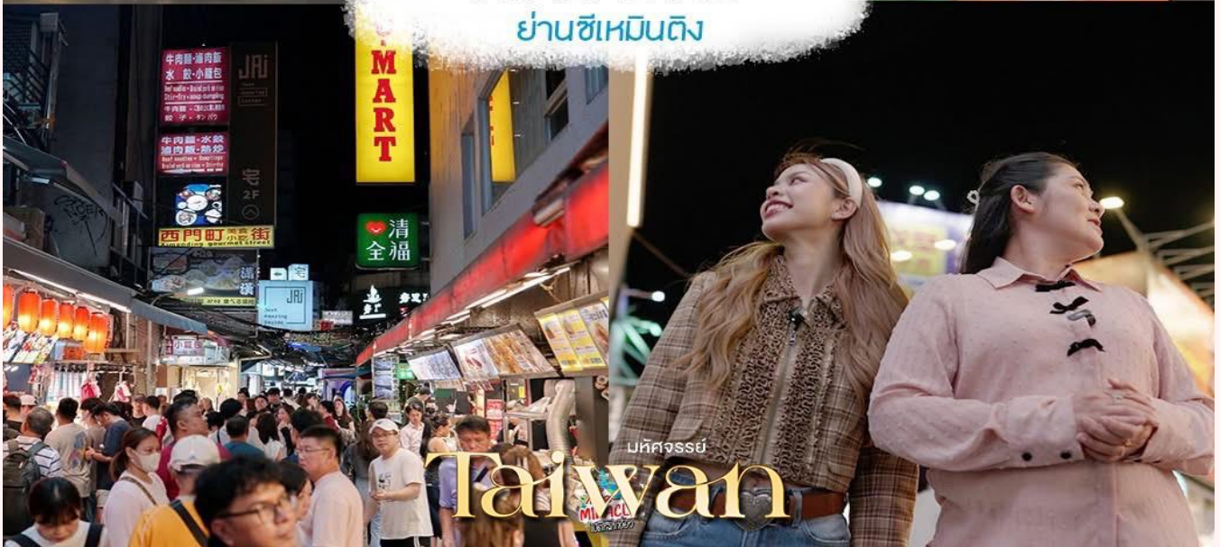
บหัทศจรรยั Taiwan