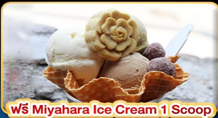
ฟรี Miyahara Ice Cream 1 Scoop

"ขอความรักวัดหลงซาน" ปล่อยคอมลอยเส้นทางรถไฟผิงซี