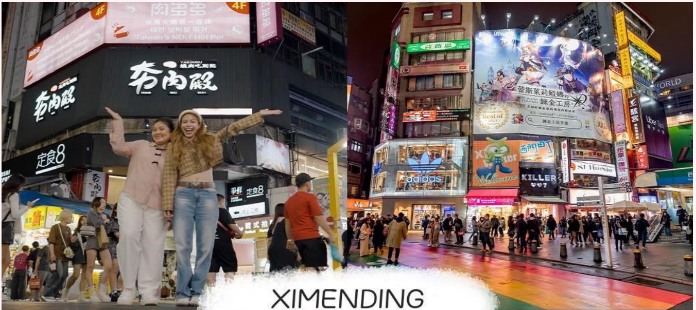
XIMENDING ย่านซีเหมินติง