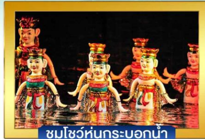
ชมโชว์หุ่นกระบอกน้ำ