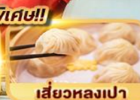
เสี่ยวหลงเปา