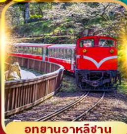
อุทยานอาลีซาน