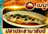
ปลาประธาราธิบดี