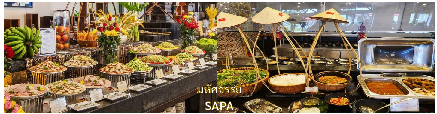
มหัศจรรย์ SAPA