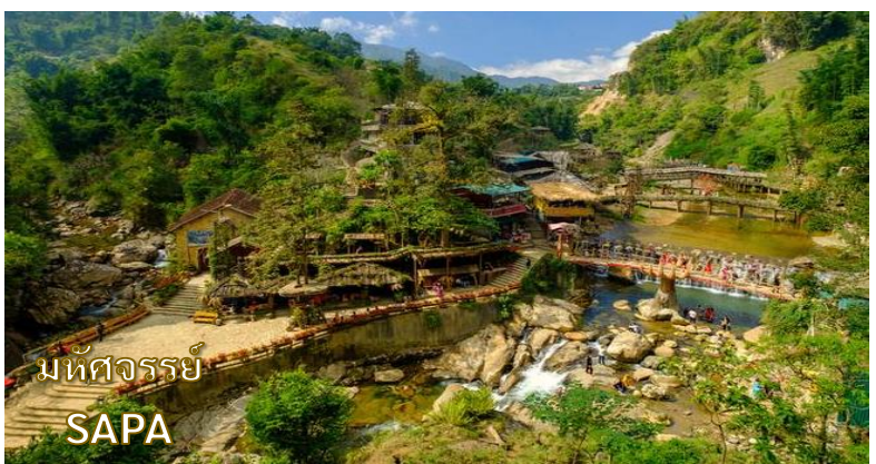
มหัศจรรย์ SAPA

เดินทางสู่ หมู่บ้านชาวเขา Cat Cat Village หมู่บ้านชาวเขาเผ่าม้งดำ ชมวิถีชีวิตความเป็นอยู่ของชาวเขาในหมู่บ้านนี้และชมแปลงนาข้าวแบบขั้นบันไดที่สวยงามกว้างสุดลูกหูลูกตา และเมื่อท่านเดินลงไปด้านล่างสุดของหมู่บ้าน จะได้สัมผัสความสวยงามของน้ำตกท่ามกลางหมู่บ้านอีกด้วย