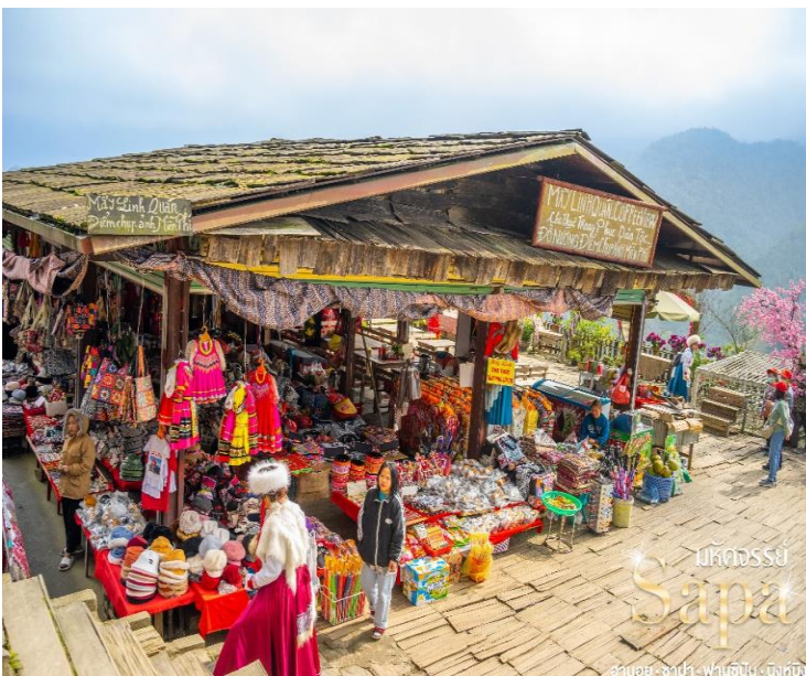
มัทศจรรย์ SAPA