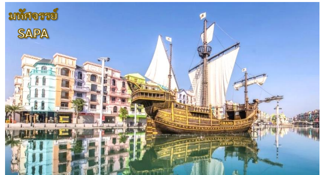
มหัทศจรรย์ SAPA

นำท่านเดินทางสู่ Mega Grand World Hanoi สถานที่ที่เที่ยวยอดฮิตแห่งใหม่ ประกอบด้วย พื้นที่จำลองเมืองเวนิส และเคทาว์นกลาง Ocean City มีการผสมผสานเสน่ห์ความเป็นตะวันออกกับความบันเทิงตะวันตกเข้าไว้อย่างลงตัว ซึ่งที่นี่มีกิจกรรมมากมาย เช่น ล่องเรือคอนโดล่า ชมเมือง “มหานครแห่งความฝัน” มีการแสดงที่ผสมผสานเทคโนโลยี mapping 3D บนผืนน้ำที่ใหญ่ที่สุดในเอเชีย - The Grand Voyage ซึ่งการแสดงจะเปิดให้เข้าชมฟรีตั้งแต่เวลา 20.00 น. ทุกวัน โดยที่นี้ร่วมศูนย์การค้า ความบันเทิง ร้านค้า ที่เที่ยว ถ่ายรูป และแหล่งพักผ่อนไว้ด้วยกัน บรรยากาศเหมือนเราหลุดไปอยู่ในยุโรป เวนิส อิตาลี (ไม่รวมกิจกรรมต่างๆ ในบริเวณ Mege Grand World)