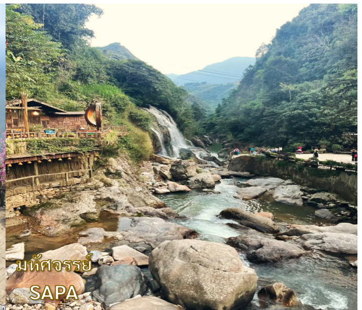
มัทศจรรย์ SAPA