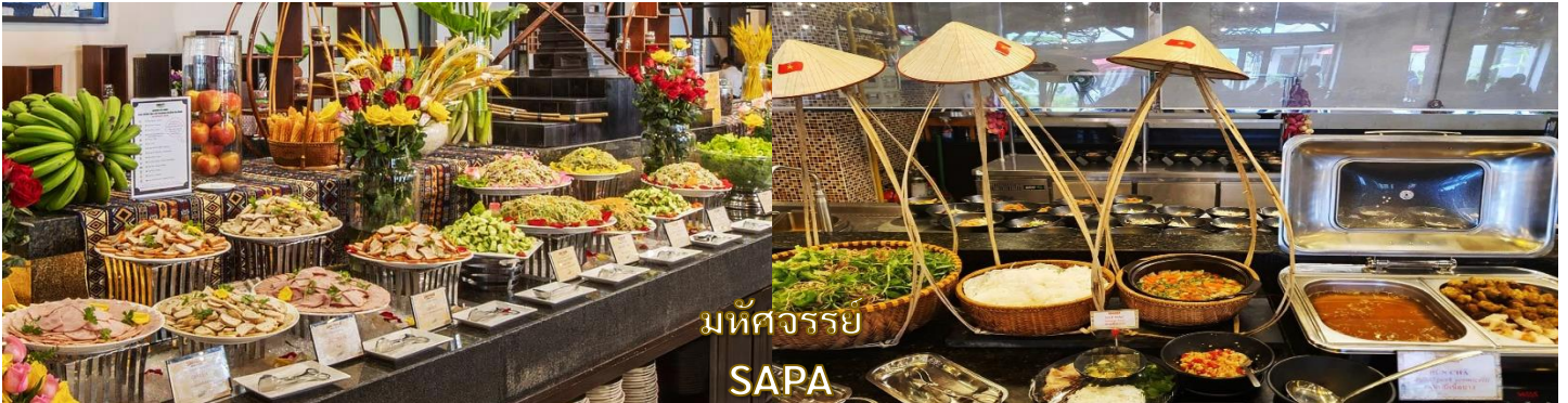
มัทศจรรย์ SAPA

บริการอาหารกลางวัน ณ ภัตตาคาร **สุดพิเศษ!! อาหารแบบบุฟเฟ่ต์ ณ VAN SAM**