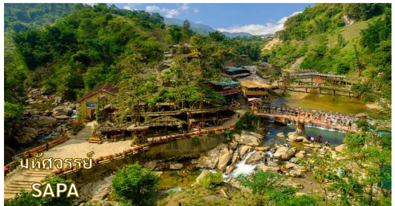
มัทศจรรย์ SAPA

ชาวเขาเผ่าม้งดำ ชมวิถีชีวิต ความเป็นอยู่ของชาวเขาใน หมู่บ้านนี้และชมแปลงนา ข้าวแบบขั้นบันไดที่สวยงาม กว้างสุดลูกหูลูกตา และเมื่อ ท่านเดินลงไปด้านล่างสุดของหมู่บ้าน จะได้สัมผัสความสวยงามของน้ำตกท่ามกลางหมู่บ้าน อีกด้วย