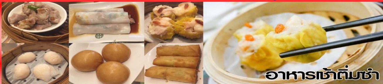
อาหารเช้าเต็มชาม

หลังจากผ่านพิธีการตรวจคนเข้าเมืองแล้วนำท่านรับประทานอาหารเช้าเมนูเต็มชาม