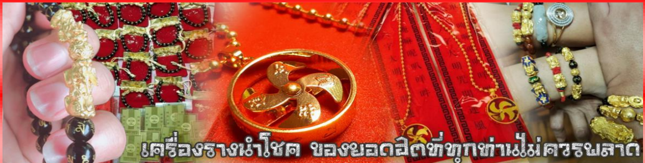
เครื่องรางนำโชค ของยอดฮิตที่ทุกท่านไม่ควรพลาด

จากนั้นนำท่านสู่ ร้านหยก ชมความงามปีเซียะ ที่เชื่อกันว่าเป็นวัตถุมงคลยอดนิยม ที่มีการนำมาบูชา เพื่อให้ช่วยป้องกันสิ่งชั่วร้าย เรียกทรัพย์สินเงินทองให้ไหลมาเทมา และกักเก็บทรัพย์นั้นไม่ให้รั่วไหลออกไปไหนได้ ชาวจิโบริกานเชื่อกันว่า ปีเซียะเป็นสัตว์ประหลาดที่รวมลักษณะของสัตว์มงคลทั้ง 5 ชนิดไว้ด้วยกัน ได้แก่ มังกร พญาราชสีห์หรือสิงโต, อินทรี, กวาง, และแมว โดยตามตำนานเล่าว่า ปีเซียะเป็นลูกมังกรตัวที่ 9 (เทพแห่งโชคลาภ) ของพญามังกรสวรรค์ มีชื่อเรียกด้วยกันหลายชื่อไม่ว่าจะเป็น “เทียนลก (กวางสวรรค์)” เป็นชื่อเดิม ส่วนจีนกวางตุ้งจะเรียกว่า “เผ่เย้า” และคนจีนแต้จิ๋วจะเรียกว่า “ผิซิว”