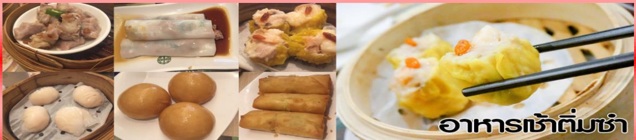
อาหารเช้าต้มซ่า

เช้า รับประทานอาหารเช้า (ต้มซ่า) ณ กัสดาดาร