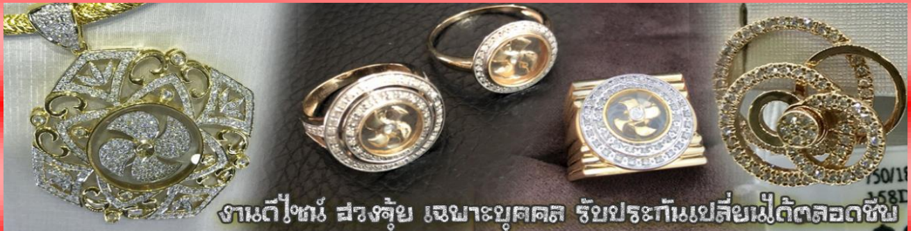
งานดีไซน์ ฮวงจุ้ย เฉพาะบุคคล รัชประเทมเปลี่ยนไม่ตัดลอดชีพ

นำท่านเยี่ยมชม โรงงานจิวเวลรี่ ที่ขึ้นชื่อของฮ่องกงพบกับงานดีไซน์ที่ได้รับรางวัลอันดับยอดเยี่ยม และใช้ในการเสริมดวงเรื่อง ฮวงจุ้ยนำความโชคดี มั่งมั่งแก่ผู้สวมใส่ ซึ่งในเมืองไทยก็ได้นิยมแพร่หลายออกไป ไม่ว่าจะเป็นกลุ่มดารา นักการเมือง พ่อค้าแม่ขายที่ประกอบธุรกิจ เจ้าของกิจการห้างร้านต่าง ๆ ซึ่งเชื่อกันว่าจะนำสิ่งดี ๆ ปัดเป่าสิ่งชั่วร้ายให้กับบุคคลที่สวมใส่ ซึ่งจะมีมากมายหลายชนิด เช่น จี้กั๊กหัน แหวนรุ่งต่าง ๆ นาฬิกาข้อมือ (ซึ่งผู้สวมใส่จะได้รับการดูลายมือจากซินแซประจำร้าน เพื่อแนะนำวิธีการเสริมดวงในการสวมใส่โดยไม่ได้ค่าบริการ)