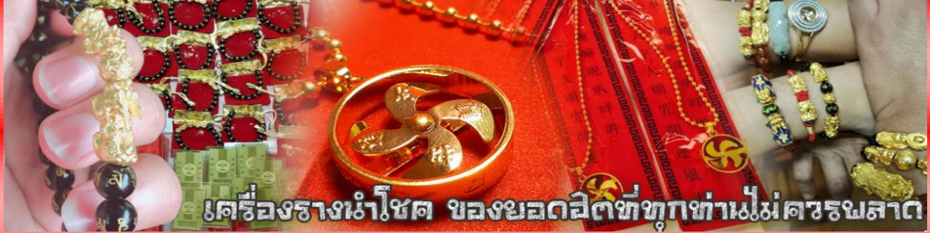
เครื่องรางนำโชค ของยอดฮิตที่ทุกท่านไม่ควรพลาด

จากนั้นนำท่านสู่ ร้านหยก ชมความงามปีเซียะ ที่เชื่อกันว่าเป็นวัตถุมงคลยอดนิยม ที่มีการนำมาบูชา เพื่อให้ช่วยป้องกันสิ่งชั่วร้าย เรียกทรัพย์เงินทองให้ไหลมาเทมา และกักเก็บทรัพย์นั้นไม่ให้รั่วไหลออกไปไหนได้ ชาวจิโบริกานเชื่อกันว่า ปีเซียะเป็นสัตว์ประหลาดที่รวมลักษณะของสัตว์มงคลทั้ง 5 ชนิดไว้ด้วยกัน ได้แก่ มังกร พญาราชสีห์หรือสิงโต, อินทรี, กวาง, และแมว โดยตามตำนานเล่าว่า ปีเซียะเป็นลูกมังกรตัวที่ 9 (เทพแห่งโชคลาภ) ของพญามังกรสวรรค์ มีชื่อเรียกด้วยกันหลายชื่อไม่ว่าจะเป็น “เทียนลก (กวางสวรรค์)” เป็นชื่อเดิม ส่วนจีนกวางตุ้งจะเรียกว่า “เผ่เย้า” และคนจีนแต้จิ๋วจะเรียกว่า “ผิซิว”