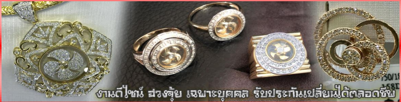
งานดีไซน์ ฮวงจุ้ย เฉพาะบุคคล รัชประทีปเปลี่ยนไม่ตกตลอดชีพ

นำท่านเยี่ยมชม โรงงานจิวเวลรี่ ที่ขึ้นชื่อของฮ่องกงพบกับงานดีไซน์ที่ได้รับรางวัลอันดับยอดเยี่ยม และใช้ในการเสริมดวงเรื่อง ฮวงจุ้ยนำความโชคดี มั่งมั่งแก่ผู้สวมใส่ ซึ่งในเมืองไทยก็ได้นิยมแพร่หลายออกไป ไม่ว่าจะเป็นกลุ่มดารา นักการเมือง พ่อค้าแม่ขายที่ประกอบธุรกิจ เจ้าของกิจการห้างร้านต่าง ๆ ซึ่งเชื่อกันว่าจะนำสิ่งดี ๆ ปัดเป่าสิ่งชั่วร้ายให้กับบุคคลที่สวมใส่ ซึ่งจะมีมากมายหลายชนิด เช่น จี้กั๊กหัน แหวนรุ่งต่าง ๆ นาฬิกาข้อมือ (ซึ่งผู้สวมใส่จะได้รับการดูลายมือจากซินเซประจําร้าน เพื่อแนะนำวิธีการเสริมดวงในการสวมใส่โดยไม่ได้ค่าบริการ)