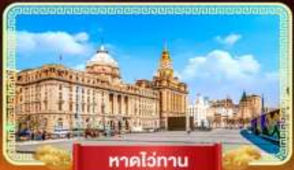
หาดไว่ทาน