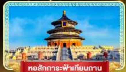
หอสังเกตการณ์เทียนถาน