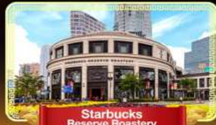
Starbucks Reserve Roastery