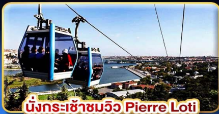
นั่งกระเช้าชมวิว Pierre Loti