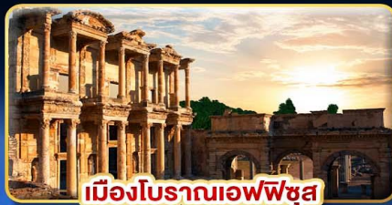
เมืองโบราณเอเฟซุส