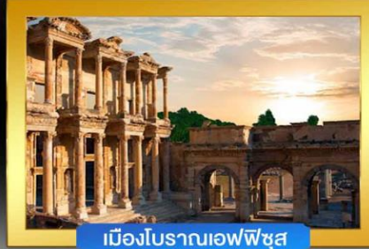
เมืองโบราณเอฟเฟซ