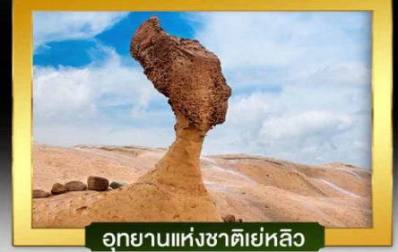
อุทยานแห่งชาติเย่หลิว