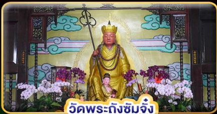
วัดพระถึงซิมจิ้ง

"ล่องเรือทะเลสาบสุริยันจันทรา" ขอความรักวัดหลงซาน