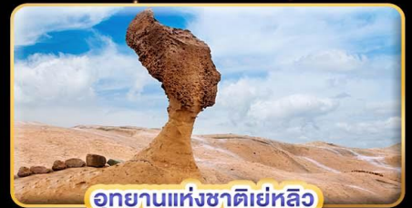
อุทยานแห่งชาติเย่หลิว