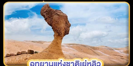
อุทยานแห่งชาติเย่หลิว