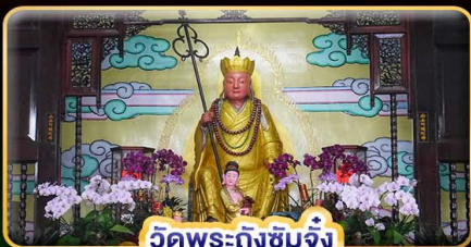
วัดพระถึงซิมจิ้ง