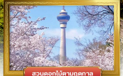
สวนดอกไม้ตามฤดูกาล