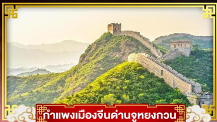
กำแพงเมืองจีนด่านจูหยงกวน

“ตะลุยสวนสนุกนิเวอแซล” ชมสิ่งมหัศจรรย์ของโลกกำแพงเมืองจีน