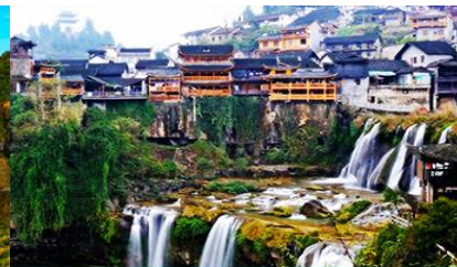
เมืองโบราณฝูหรงเจิน

วันที่สี่ จางเจียเจี๋ย-พิพิธภัณฑ์ภาพหินทราย – ศูนย์จำหน่ายผลิตภัณฑ์ยางพารา-อุทยานไ้อ้าย-เมืองโบราณฝูหรงเจิน