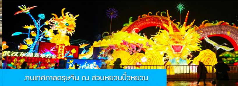
งานเทศกาลตรุษจีน ณ สวนหยวนเป๋วหยวน

วันที่ห้า เมืองจางเจียเจีย – เมืองเก็งจิว – นั่งรถไฟความเร็วสูงสู่หนครหวู่ฮั่น – เที่ยวงานฉลองเทศกาลตรุษจีน ร่วมงานเลี้ยงอาหารค่ำต้อนรับของทางการมณฑลหูเป่ย์ – นั่งรถไฟความเร็วสูงกลับเมืองหยีซัง