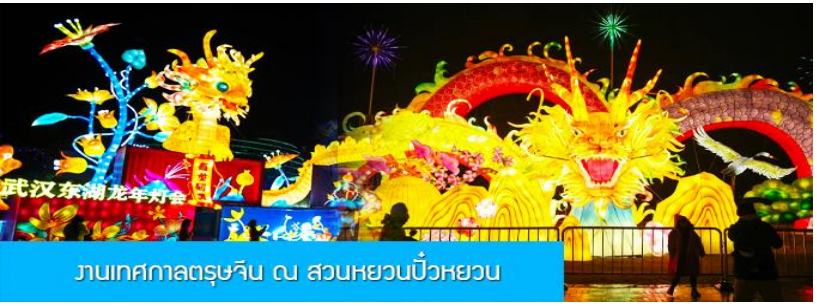
งานเทศกาลตรุษจีน ณ สวนหยวนเป๋วหยวน

วันที่ห้า เมืองจางเจียเจีย – เมืองเก็งจิว –นั่งรถไฟความเร็วสูงสู่หนครหวู่ฮั่น – เที่ยวงานฉลองเทศกาลตรุษจีน ร่วมงานเลี้ยงอาหารค่ำต้อนรับของทางการมณฑลหูเป่ย์ – นั่งรถไฟความเร็วสูงกลับเมืองหยีซัง