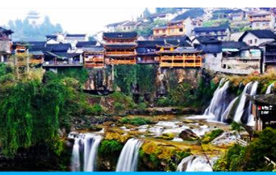
เมืองโบราณฝูหรงเจิ้น

วันที่สี่ จางเจี๋ยเจี๋ย-พิพิธภัณฑ์ภาพหินทราย – ศูนย์จำหน่ายผลิตภัณฑ์ยางพารา-อุทยานอ้ายจ้าย-เมืองโบราณฝูหรงเจิ้น