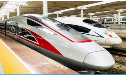
บัตรรถไฟความเร็วสูง

https://hk.trip.com/hotels/guzhang-hotel-detail-68614854/chaxitai-holiday-hotel/