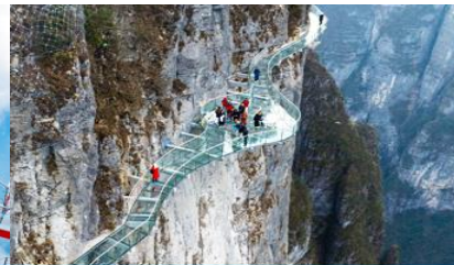
ระเบียงทางเดินเลียบนหน้าผา

วันที่สาม จางเจียเจีย-ศูนย์สมุนไพรจีน-ผลิตภัณฑ์ยางพารา- กระเช้าขึ้น/ลงเขาเจ็ดดาว – ระเบียงชมวิว Sky Eye - ระเบียงทางเดินเลียบนหน้าผา – (เลือกซื้อโปรแกรมเสริม โชว์จิ้งจอกขาว)