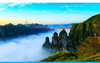
อุทยานป่าไม้แห่งชาติอ้ายจ้าย